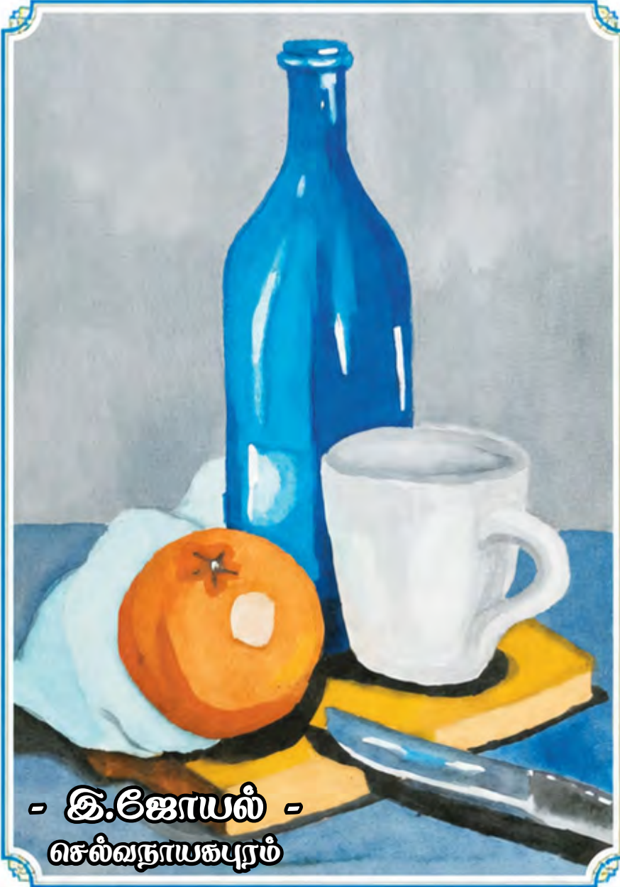
- இ.ஜோயல் - செல்வநாயகபுரம்