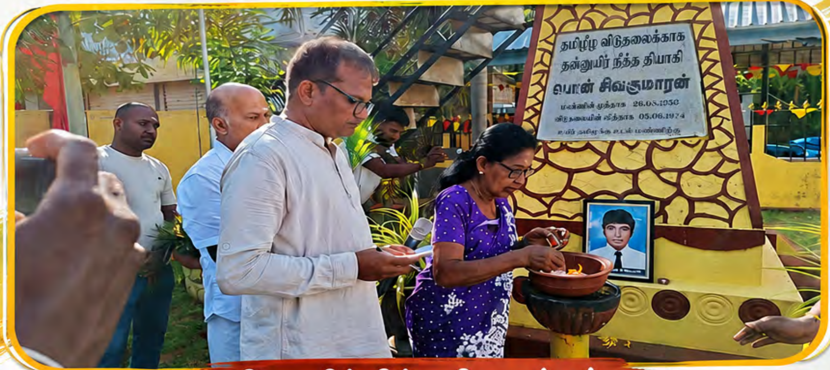
நினைவில் நின்ற தியாகங்கள்