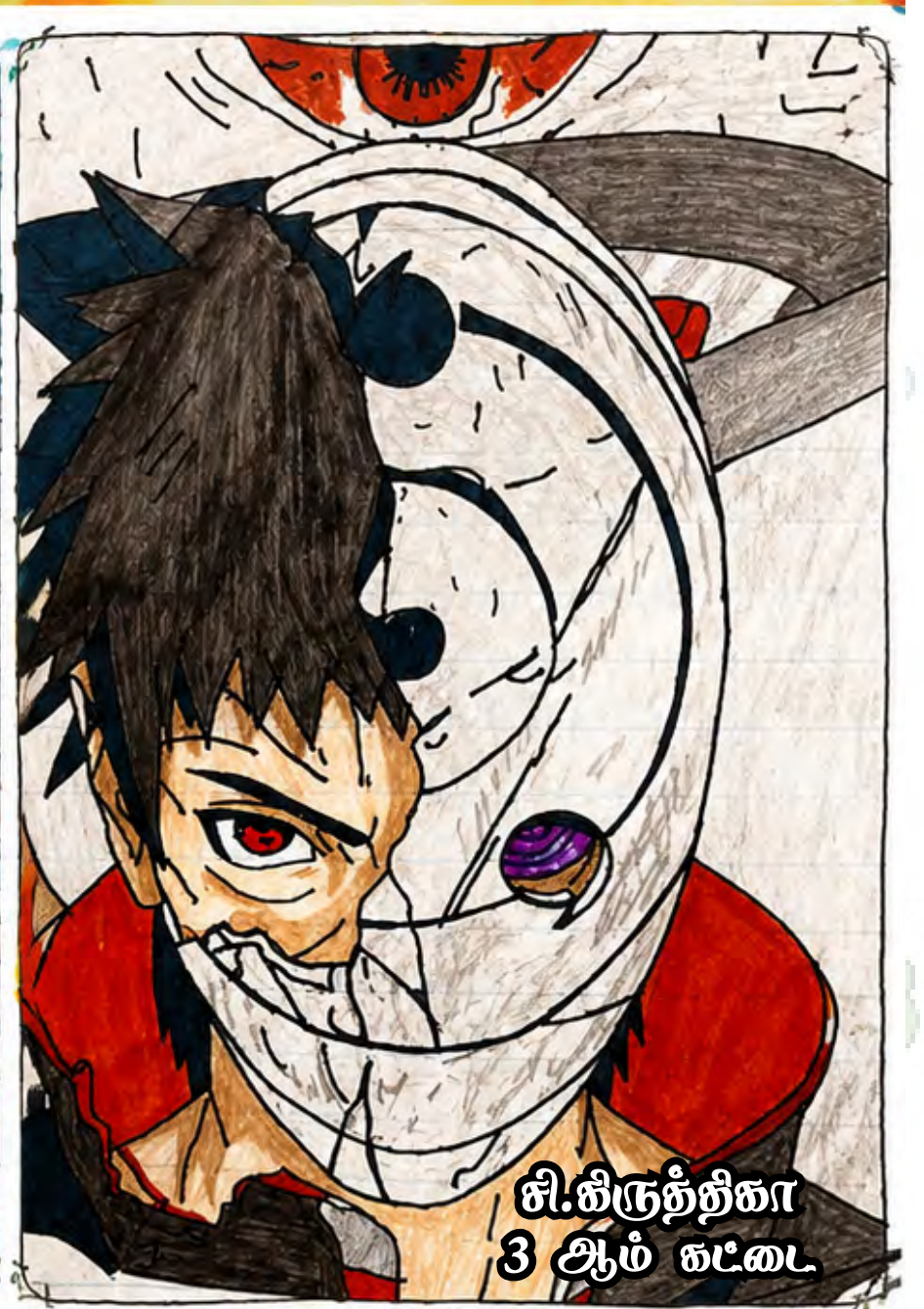
சி.கிருத்திகா 3 ஆம் கட்டை