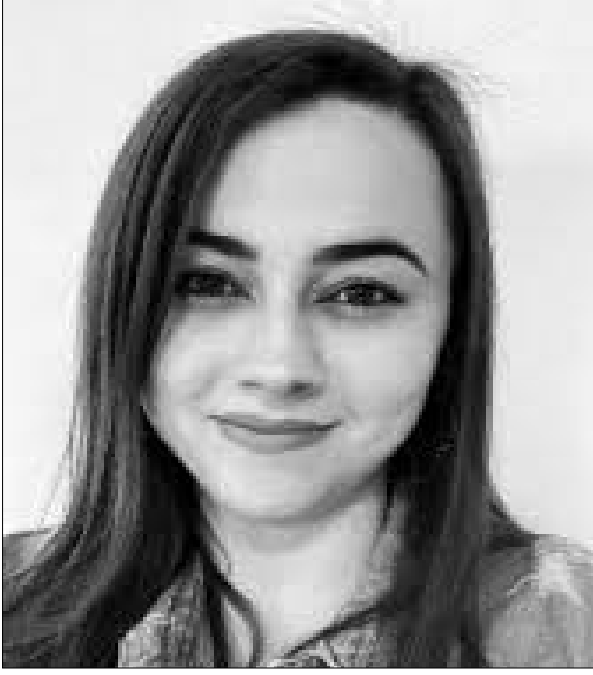
படைத்துறை ஆய்வாளர் ரியோ டி ஜெனிரேர் பிரேசில்