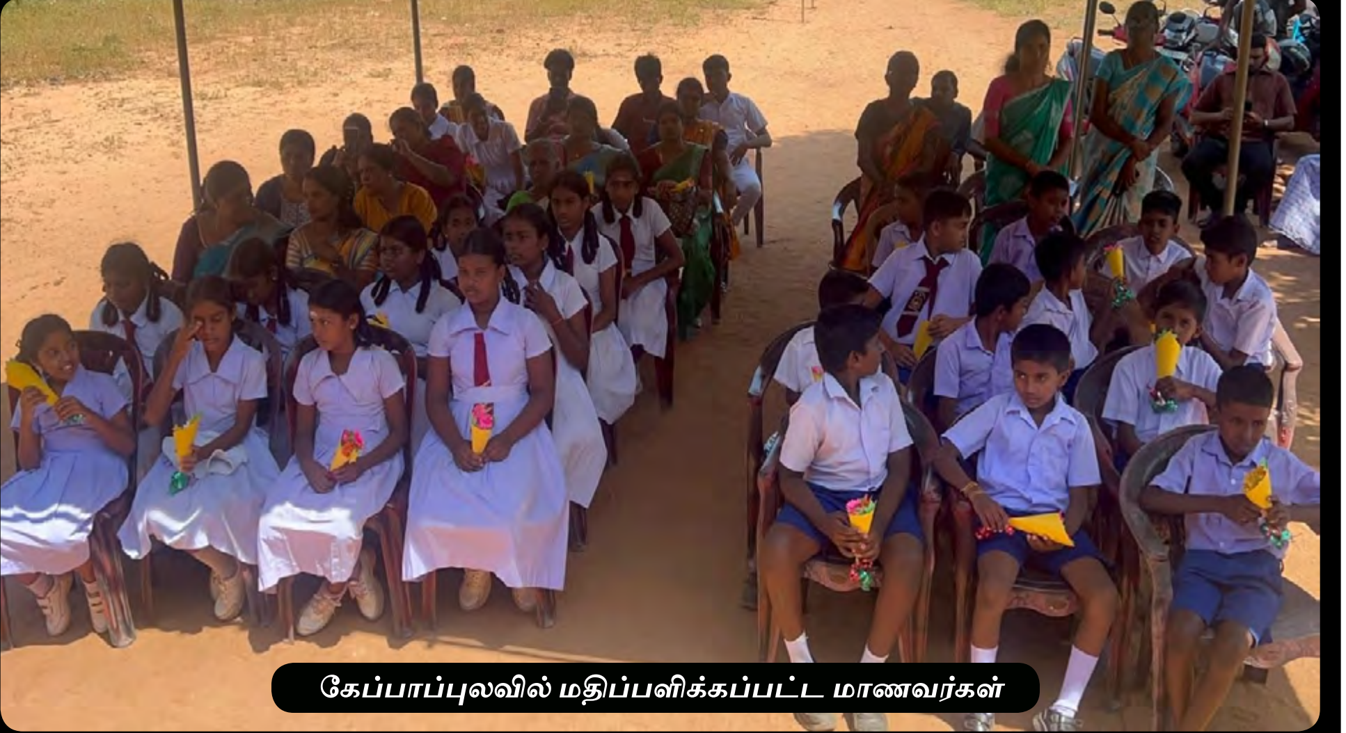
கேப்பாப்புவலவில் மதிப்பளிக்கப்பட்ட மாணவர்கள்