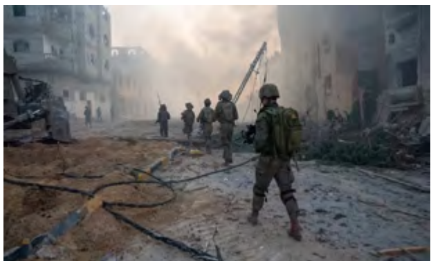
கட்டார், எகிப்து, அமெரிக்கா, இன்னும் பலரால் போர் நிறுத்தம் ஒன்றை ஏற்படுத்த

உண்மையில் காஸாவின் இன்றைய நிலைமை மிகவும் கவலைக்குரியதாகவே இருக்கிறது. தற்போது அங்கே நடைபெற்று வருகின்ற போர், 2023 ம் ஆண்டு ஒக்டோபர் மாதம் 7ம் தகதி, ஹமாஸ் போராளிகள் இஸ்ரேலுக்குள் ஊடுருவி மேற்கொண்ட தாக்குதலைத் தொடர்ந்து நடைபெற்று வருகிறது. அந்தத் தாக்குதலில் 1100 இஸ்ரேலியர் கொல்லப்பட, 250 பேர் பணயக் கைதிகளாகப் பிடித்துச் செல்லப்பட்டார்கள். அந்தத் தாக்குதலுக்குப் பின்னர் ஹமாஸ் மீது இஸ்ரேல் தொடர்ச்சியாக நடத்தி வரும் தாக்குதலில் 44000 பாலஸ்தீனியர்கள் கொல்லப்பட்டிருக்கிறார்கள். இதில் பெரும்பாலானவர்கள் அப்பாவிப் பொது மக்கள் ஆவார். மேற்குறிப்பிட்ட எண்ணிக்கை ஹமாஸின் நிர்வாகத்தில் உள்ள சுகாதார அமைச்சினால் வெளியிடப்பட்டிருக்கிறது. பல சுயாதீன உதவி நிறுவனங்கள் இந்த எண்ணிக்கையை உறுதிப்படுத்தியிருக்கின்றன. ஹமாஸின் இராணுவ பலத்தை பெருமளவில் தாம் அழித்துவிட்டதாக இஸ்ரேல் மார்தட்டுகிறது. இன்று 15 மாதங்கள் கடந்து விட்ட நிலையில், காஸாவின் பெரும்பகுதி முற்றாக அழிந்து சுடுகாடாகக் காட்சியளிக்கிறது. அங்குள்ள மொத்த 2.4 மில்லியன்கள் சனத் தொகையில், ஒரு மில்லியனுக்கு மேற்பட்ட மக்கள் இப்போரின் காரணமாக பல தடவைகள் இடப் பெயர்வுக்கு உள்ளாக்கப்பட்டிருக்கிறார்கள். இந்த அகதிகளில் பெரும்பாலானோர் கூடாரங்களுக்குள், மிகவும் மோசமான சூழலில் வாழ்ந்து வருகிறார்கள். கோடை காலத்தில் பாம்பு, தேள், சொறி சிரங்கு போன்றவற்றின் பாதிப்புகளுக்கும், குளிர் காலத்தில் சீரற்ற காலநிலைகளாலும் பாதிக்கப்பட்டு வருகிறார்கள்.