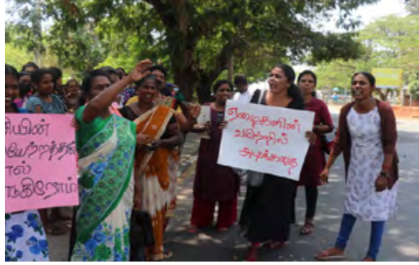
பகுதியில் இது தொடர்பான துண்டுப் பிரசுரமும் விநியோகிக்கப்பட்டு வாசகங்களும் பல இடங்களில் ஒட்டப்பட்டன.