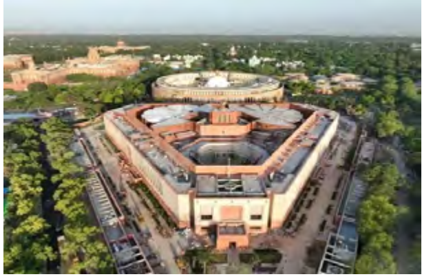
அண்மையில் புதிய நாடாளுமன்றக் கட்டடம் திறக்கப்பட்ட போது ஒரு