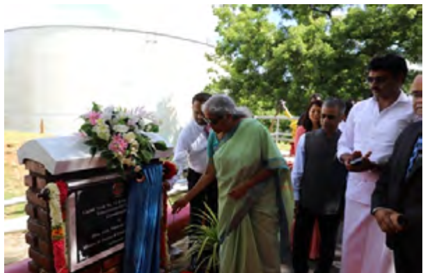
இலங்கையில் யுத்தத்தின் இறுதிச்

இந்த ஆண்டு இந்த நாட்டில் தமிழர்கள் அடக்கப்பட்ட இனமாகவும் இருள்குழந்த இனமாகவும் வாழ்கின்றார்கள் என்பதை சர்வ தேசத்திற்கு எடுத்துக்காட்டும் வகையில் இலங்கையின் சுதந்திர தினத்தை கறுப்பு சுதந்திர தினமாக மட்டக்களப்பு மக்கள் அனுஸ்டித்ததுடன் இலங்கை சுதந்திர தினத்தன்று தமிழர்களின் உரிமையினை வலியுறுத்தி போராட்டம் ஒன்றையும் முன்னெடுத்திருந்தனர்.