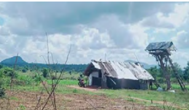
இந்த நிலைமை கிழக்கினைப்பொறுத்த

கிழக்கில் தமிழர்கள் சிறுபான்மையினராக மாற்றமடையும் நிலைமை வேகமாக ஏற்பட்டுவருகின்றன. அண்மைக்காலமாக வெளி நாடுகளுக்கு புலம்பெயரும் நிலைமை அதிகளவில் தமிழ் மக்கள் மத்தியிலேயே காணப்படுகின்றது. சராசரியாக மாதம் ஒன்று நூறு பேராவது கிழக்கிலிருந்து புலம்பெயரும் நிலைமையானது தமிழர்களின் இருப்பினை இன்னும் கேள்விக்குட்படுத்தும் நிலைமையே காணப்படுகின்றது.