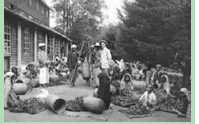
தொழிலாளர்களின் சமூக நலனிற்கு தொழில் வழங்குநரே பொறுப்பு என்பதனை வலியுறுத்தியது.

இதேவேளை 'தோட்ட மக்கள் தமது அன்றாட தேவைகளை பூர்த்தி செய்து கொள்வதற்கு முற்றுமுழுதாக தோட்ட முறைமையிலேயே தங்கி இருக்கும் நிலை அங்கு காணப்படுகின்றது. வாழ்க்கைக்குத் தேவையான அடிப்படை வசதிகள் அனைத்தும் தோட்ட எல்லைக்குள்ளேயே தனியொரு அமைப்பின் கீழ் வழங்கப்படுவதால் இவை சுயதேவைகளை பூர்த்தி செய்யும் அலகுகளாக விளங்குகின்றன. இதன் காரணமாக அவற்றை பூரணத்துவ தன்மை கொண்ட அமைப்புக்களென்று கருதுவது பொருத்தமானதேயாகும். வாழ்க்கையின் வேறுபட்ட மூன்று கூறுகளாகிய தொழில், வாழ்க்கை முறை, பொழுதுபோக்கு என்பவற்றை