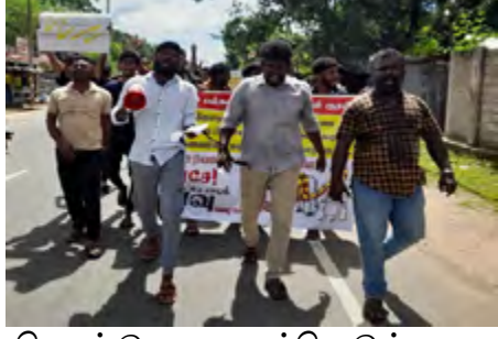
கொண்டு அது முன்னெடுத்து வருகின்றது.

இந்த போராட்டம் தொடர்பில் இலங்கை அரசு அக்கறை கொள்ளவில்லை என்பதுடன், அதனை முறியடிக்கும் திட்டங்களை சிங்கள பௌத்த துறவிகள் மற்றும் அரசியல்வாதிகளை