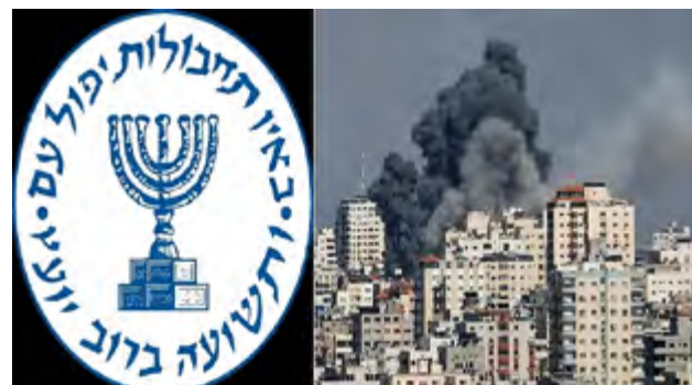
புலனாய்வுத் தகவல்களை இஸ்ரேல்

அரசியல் ரீதியாக இஸ்ரேல் பிளவுபடுவதற்கான காரணம் பிரதம மந்திரி நெத்தன்யாகு தலைமையில் இயங்குகின்ற இஸ்ரேலின் வலதுசாரி அரசு முன்வைத்த ஒரு சட்டமூலம். இஸ்ரேலை இதுவரை ஆட்சி செய்த அரசுகளில் மிக அதிமாக வலதுசாரித்தன்மை கொண்ட அரசு இந்த அரசுதான். இந்தச் சட்டமூலம் நீதிபரிபாலனக் கட்டமைப்பை வலுவழிக்கச் செய்யும் என்ற அச்சம் எல்லோர் மத்தியிலும் இருந்தது. அந்த அரசை எதிர்த்தவர்கள் தமது வாராந்த ஆர்ப்பாட்டங்களின் போது இந்தக் கருத்தையே முன்வைத்தார்கள். இஸ்ரேல் மக்கள் நடுவில் ஏற்பட்ட இந்தக் குழப்பம் இஸ்ரேலின் புலனாய்வைத் திசைதிருப்பிய பின்னணிச்சத்தமாக (background noise) அமைந்தது.