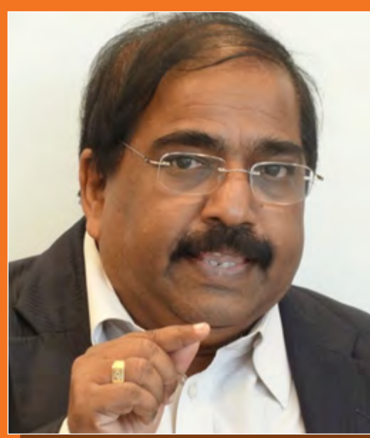
தெரிவித்த கருத்துக்களின் முக்கிய பகுதிகளை இலக்கின் வாசகர்களுக்காக இங்கே தருகின்றோம்.