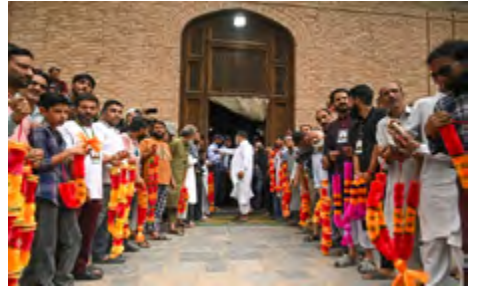
கொண்டிருந்தார். இதன்போது பெருமளவான மக்கள் அங்கு கூடியிருந்தனர்.

இதனிடையே, கனடாவின் விசாரணைகளுக்கு இந்தியா ஒத்துழைக்கவேண்டும் என அமெரிக்கா தெரிவித்துள்ளது. அதேசமயம் கனடாவுக்கும், அமெரிக்காவுக்கும் இடையில் விரிசல்கள் உள்ளதாக வெளிவந்த செய்திகளையும் அமெரிக்கா மறுத்துள்ளது.