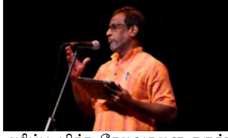
ணிப்பு மிக்க சேவைகளை சுருக்கமாக எடுத்துரைத்தார்.