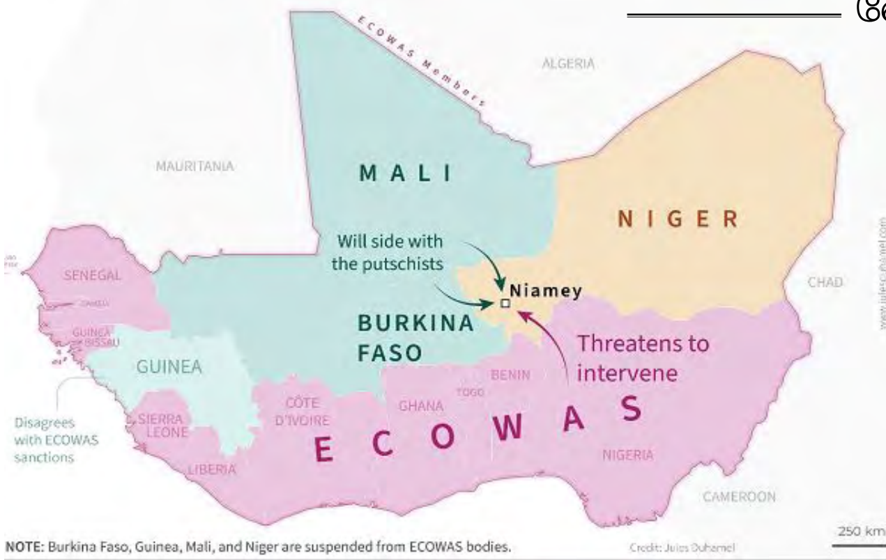
NOTE: Burkina Faso, Guinea, Mali, and Niger are suspended from ECOWAS bodies.

என்பது விகிதமான நிலப்பரப்பை சகாரா பாலவனம் விழுங்கி நிற்க, 25 மில்லியன் மக்கள் தொகையை கொண்ட உலகின் மிக வறிய நாடான நைஜெரில் இந்த வாரம் இடம்பெற்ற இராணுவ புரட்சி உலகின் கவனத்தை ஈர்த்தது மட்டுமல்லாது, புதிய களமுனை ஒன்றும் திறக்கப்படலாம் என்ற அச்சத்தை தோற்றுவித்துள்ளது.