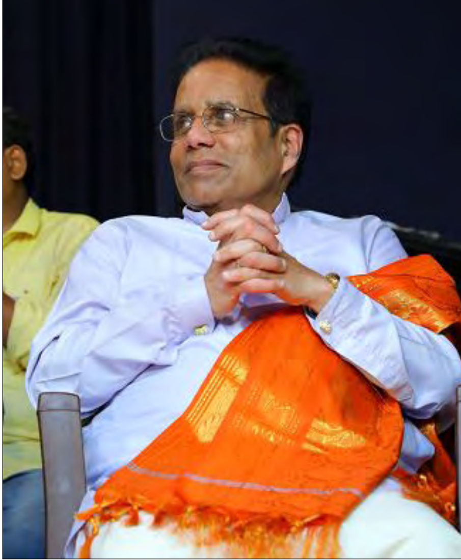
பாளிகளின் கதைகளை இசையும் கதையுமாக அரங்கேற்றிப் பெரும் புகழைச் சம்பாதித்தவர்.