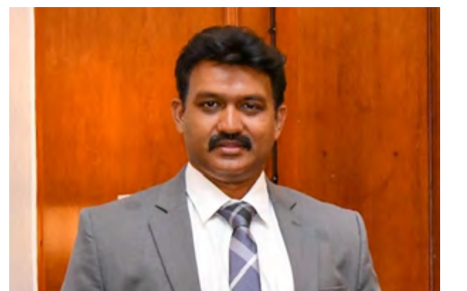
தொடர்ச்சி 13 ஆம் பக்கம்

இந்த மாகாணம் தொடர்பில் தமிழர், சிங்களவர்களுக்கிடையிலான முரண்பாடுகள் ஒருபுறமிருக்க, நாட்டில் முஸ்லிம்கள் செறிந்து வாழும் முக்கிய பகுதியாகவும் கிழக்கு மாகாணம் காணப்படுவதன் காரணமாக தமிழர்கள் மத்தியில் முரண்பாடுகள் பல வகையிலும் தோற்றுவிக்கப்படுகின்றன. குறிப்பாக கிழக்கில் தமிழர்களின் ஆதிக்கம் எழுந்துவிடக்கூடாது என்பதற்காக கடந்த காலத்தில் பல்வேறு மோதல்கள் தமிழர்கள் மீது கட்டவிழ்த்துவிடப்பட்டன. இந்த மோதல்கள் காரணமாக அம்பாறை மாவட்டத்தின் 18க்கும் மேற்பட்ட தமிழ் கிராமங்களிலிருந்து தமிழர்கள் அகற்றப்பட்டார்கள். இவ்வாறு திருகோணமலை மாவட்டத்திலும் பல கிராமங்களிலிருந்து தமிழர்கள் அகற்றப்பட்டனர். இன்று மட்டக்களப்பு மாவட்டத்திற்குள் மட்டுமே