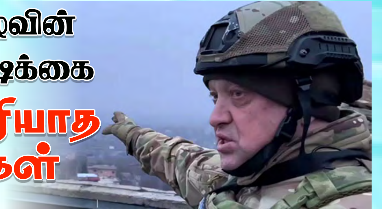
வேல்ஸ் இல் இருந்து: அருள்