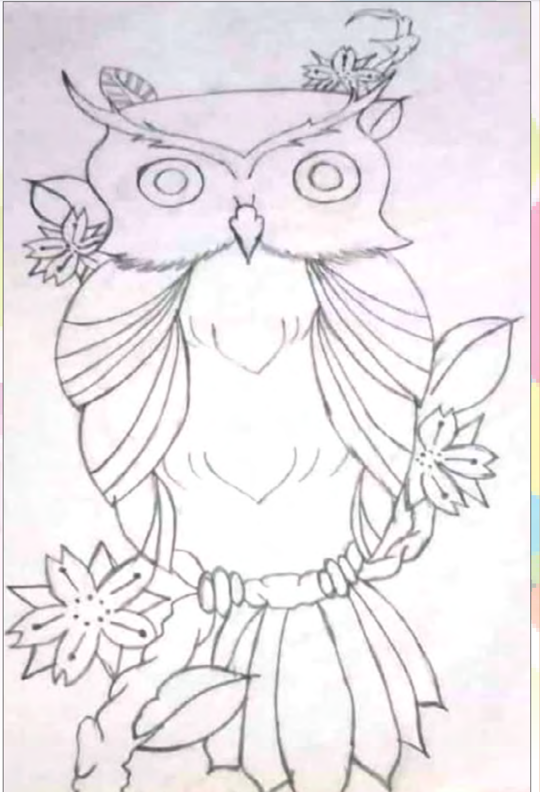
சு.சுவாகீஸ் தி/விபுலானந்தா கல்வாரி