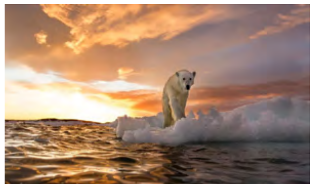
காரணம் பூமி வெப்பமயமாகிக் கொண்

கல்வி நிறுவனங்கள், மாணவர்கள் மதிப்பெண்கள் அதிகம் பெறுவதிலும், தரமான கல்வி என்ற பெயரில் வெளிநாட்டு மோகத்தை வளர்த்துக் கொண்டிருக்கின்றன. உயர் தொழில்நுட்பங்களைக் கற்றுக்கொள்வதும் வெளிநாடுகளுக்குச் செல்ல வேண்டும் என்று எண்ணுவதும் தவறில்லை. ஆனால் அதுமட்டும் தான் நோக்கமாக இருக்குமாயின் அந்த இலக்கு தவறானது.