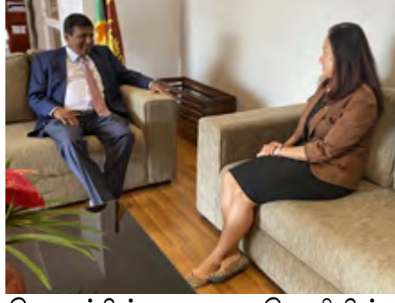
தொடர்பில், கவலை வெளியிட்டதாகவும் அமெரிக்க தூதுவர் தெரிவித்துள்ளார்.

சர்வதேச தரத்திற்கு, புறம்பாக முன்மொழியப்பட்ட, சட்டமூலத்தின் சில விடயதானங்கள்