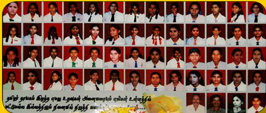
தமிழ்நாட்டில் கிழந்த ஏழை உறவுகள் அமைச்சரவை அமைச்சர் உள்முத்தம் மட்டுமல்ல கிழந்த ஏழை உறவுகள் அமைச்சர் உள்முத்தம்

நிசப்த்தின் நரம்புகளில் - நின் நினைவுகளை மீட்ட நினைக்கின்றோம். - அங்கே ..... விழிமடல் நீர்மழை சொரிந்திட விம்மியழுகின்றது இதயம்.- அதில் அழியாத உம் முகங்கள் அரங்கேறுகிறது - ஆத்மாவின் மொழியில்லாக் காவியமாய். காலங்கள் பலவாக கட்டிக்காத்திட்ட கல்விக்