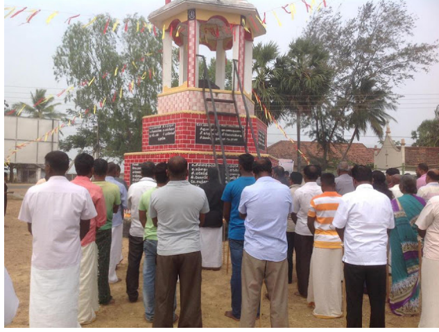
வருடங்களின் பின்னர் 1991 யூன் மாதம் 12ஆம் நாள் இடம் பெற்ற மற்றும்மோர் படுகொலைச் சம்பவத்தில் சிறீலங்கா இராணுவத்தினரால் பெண்கள் குழந்தைகள் உட்பட 152 பேர் படுகொலை செய்யப்பட்டிருந்தனர் என்பதும் இங்கு குறிப்பிடத்தக்கது

உள்நூர் பணியாளர்கள் உட்பட 87 பேர் கடத்திச் செல்லப்பட்டு சுட்டுக் கொல்லப்பட்டு வீதியில் போட்டு எரிக்கப்பட்டனர். இந்த படுகொலைச் சம்பவம் இடம்பெற்று 14