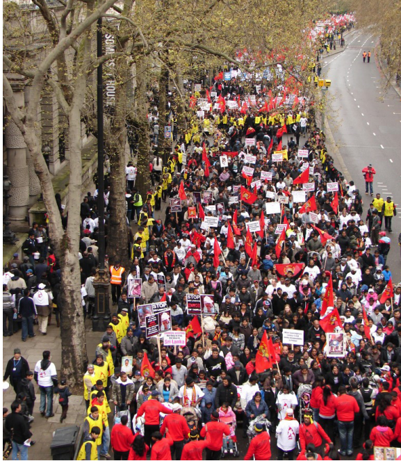
பொதுமக்களையும் சில்வா தலைமையிலான 58 ஆவது படையணியே அதிகளவில் படுகொலை செய்திருந்தது.

2009 ஆம் ஆண்டு இடம்பெற்ற போரில் வைத்தியசாலைகள் மீதும் பொதுமக்கள் மீதும் மீண்டும் மீண்டும் பீரங்கித் தாக்குதல்களை மேற்கொண்டு பெருமளவான பொதுமக்களையும், காயமடைந்த நோயாளிகளையும் படுகொலை செய்ததில் சில்வாவின் பங்கு அதிகம். அது மட்டுமல்லாது சரணடைந்த போராளிகளையும்,