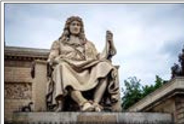
ஜீன் பபிரிஸ்ற் கொல்பேட்

பிரான்ஸ் அரசர் 14 ஆவது லூயிஸ் காலத்தில் 17 ஆம் நூற்றாண்டில் அமைச்சராக இருந்த இவர்குறுப்பு இனத்தவர்களுக்கு எதிராக அடிமைச்சட்டத்தை வரைவதில் முன்னின்றவர். பிரான்ஸ் நகரசபை முன் உள்ள இவரின் சிலையை அகற்றுவதற்கு கடந்த வாரம் ஆர்ப்பாட்டக்காரர்கள் முயற்சி எடுத்திருந்தனர்.