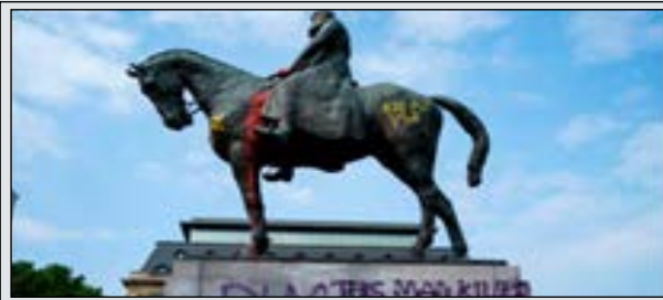
அரசர் லிபோல்ட் இரண்டு

1865 தொடக்கம் 1909 வரை பெல்ஜியத்தை ஆட்சி புரிந்தவர். கொங்கோ நாட்டை தனது சுய தேவைக்காக பயன்படுத்தியவர். மிருகத்தனமான துன்புறுத்தல்களை மேற்கொண்டு 10 மில்லியன் மக்களை அங்கு படுகொலை செய்தவர். இவரின் சிலைகள் பல சேதமாக்கப்பட்டுள்ளதுடன், பல வர்ணமைகள் பூசப்பட்டு சேதமாக்கப்பட்டுள்ளன.