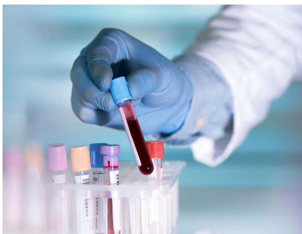
“இனி மரணம் எப்போது வரும் என்பதை கண்டுபிடித்துச் சொல்ல

இந்த குதித்தல் நாம் கண் சிமிட்டும் நேரத்தை விட 2300 மடங்கு வேகத்துடன் நிகழ்கிறது. எறும்புகளின் சுறு சுறுப்புத் தன்மை என்றுமே நம்மை ஈர்த்து அதன்பால் ஆய்வுகளை மேற்கொள்ள உதவி வருகிறது. நாமறிந்த எறும்புகளில் 'சுள்ளெறும்பு' என்பது அசைவ உண்ணிகள், 'சாமி எறும்பு' என்பவை சைவ உண்ணிகள். உலக அளவில் எறும்பைப் பற்றி குறிப்பாக ஒவ்வொரு வகை எறும்புகளைப் பற்றியும் பல ஆய்வுகள் நடைபெற்று வருகின்றன.