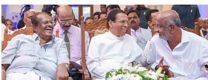
காணாமல் ஆக்கப்பட்டோர் தினத்தில் சனாதிபதியுடன் சிரிப்பு மழையில் தமிழ்த்தேசியக் கூட்டமைப்பினர்

சர்வதேச காணாமலாக்கப்பட்ட தினத்தில் தமிழ்த் தேசியக் கூட்டமைப்பின் இரட்டை வேடம் அம்மபலமாகியுள்ளது. சர்வதேச காணாமலாக்கப்பட்ட தினத்தில் தமிழர் தாயகத்தில் வலிந்து காணாமலாக்கப்பட்ட உறவுகளால் பாரிய கவனயீர்ப்பு போராட்டங்கள் முன்னெடுக்கப்பட்டிருந்தன. இதில் கிழக்கில் நடைபெற்ற போராட்டங்களில் தமிழ்த் தேசியக் கூட்டமைப்பின் எந்தவொரு மக்கள் பிரதிநிதிகளும் பங்கேற்றிருக்கவில்லை.