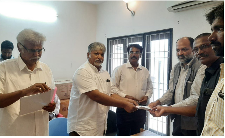
சிறீலங்காவுக்கு அழுத்தம் தருமாறு வலியுறுத்துகிறோம்.