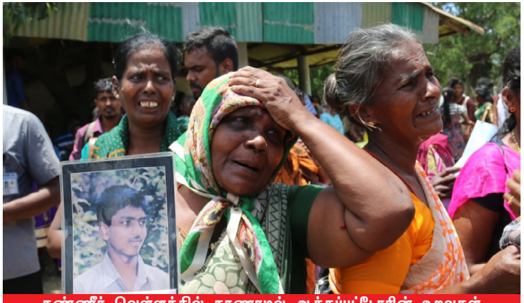
கண்ணீர் வெள்ளத்தில் காணாமல் ஆக்கப்பட்டோரின் உறவுகள்

காணாமலாக்கப்பட்ட உறவினரின போராட்டத்தில் திட்டமிட்டு பங்கேற்காமையே, ஒருசில உறுப்பினர்கள் திட்டமிட்டு பங்கேற்க வைக்கப்பட்டமை, சனாதிபதியின் முன்கேள்விகேட்பதற்கான வாய்ப்பிருந்தும் கூட மௌனம் காத்தது மட்டுமன்றி அவருடைய அபிவிருத்தி திட்டங்களுக்காக நன்றி தெரிவித்தமை என அனைத்துச் செயற்பாடுகளுமே வாக்குவங்கியை மையப்படுத்தி மக்களின் உணர்வுகளுடன் விளையாடும் அரசியல் நாடகம் என்பது அப்பட்டமாக வெளிப்பட்டுள்ளதாக மக்கள் விசனம் தெரிவித்துள்ளனர்.