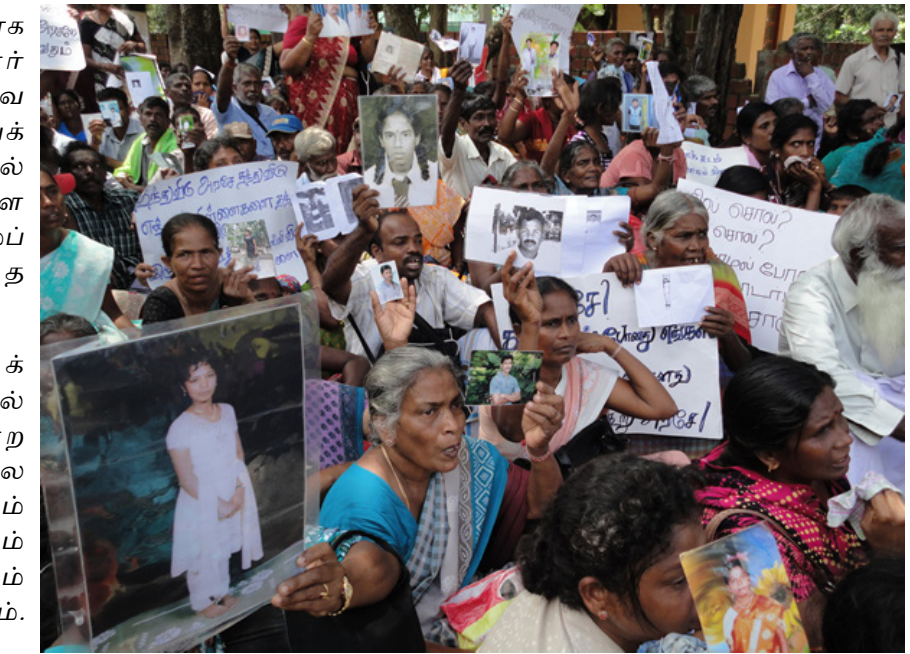
இந்திய அலுவலகத்திற்கு முன் அனுப்புவதாக கூறினார்.