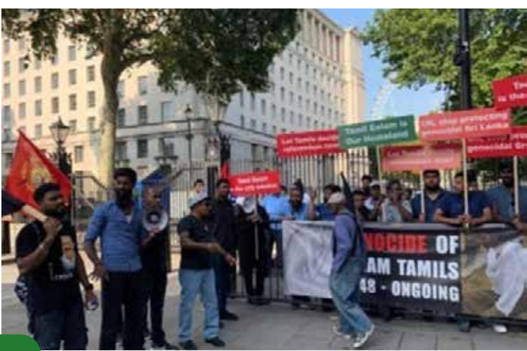
பிரித்தானிய பிரதமர் வாசத்தலத்திலே