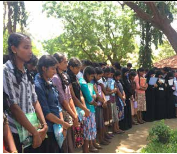
யாழ் பல்கலைக் கழகத்தில்