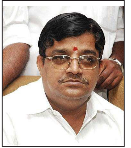
இந்திய நாடாளுமன்ற உறுப்பினர் மைத்திரேயன் (அ.தி.மு.க)