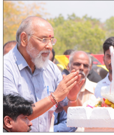
வவுனியா பொங்குதமிழ் மண்டபத்தில்