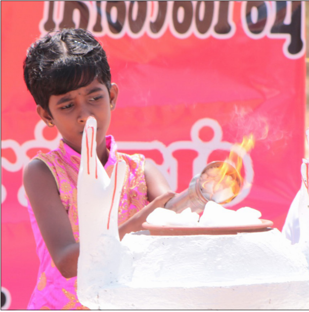
இராணுவத்தின் தீவிர கழுகுப்பார்வைக்குள்ளும், காவல் துறையினர், புலனாய்வாளர்களின் கண்காணிப்புக்குள்ளும் சிறிலங்கா அரசு

இனப்படுகொலைக்கு நீதிகோரி கண்ணீர் காணிக்கையுடன் கதறி அழுத உறவுகள்