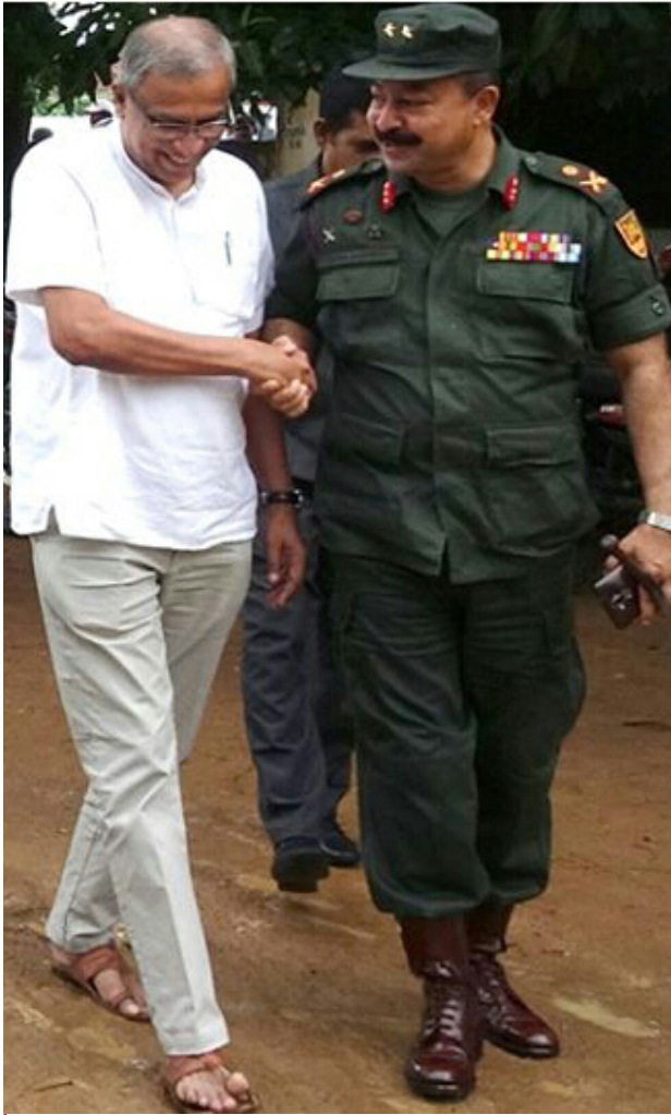
வெளியேறின. அவர்களால் உருவாக்கப்பட்ட ஆயுதக்குழுக்களும் துடைத்தழிக்கப்பட்டன.

கொள்கை வகுப்பாளர்களும் ஜெயவர்த்தனாவும் இணைந்து உருவாக்கிய இலங்கை — இந்திய ஒப்பந்தம் நிர்மூலமானது நிரந்தரமாக தளம் அமைக்கும் நோக்கத்துடன் வந்திறங்கிய இந்தியப் படைகள்