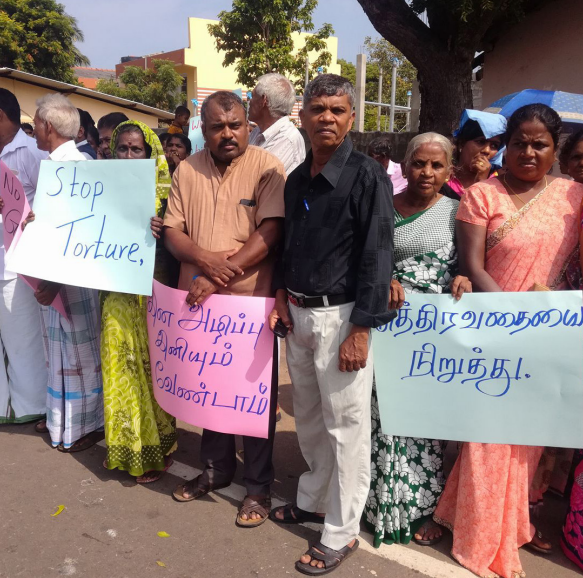
மனித உரிமை பணியாளர்களும் காணாமல் போனவர்களின் உறவினர்களின் மனித புதைகுழி விவகாரத்தில் நீதி