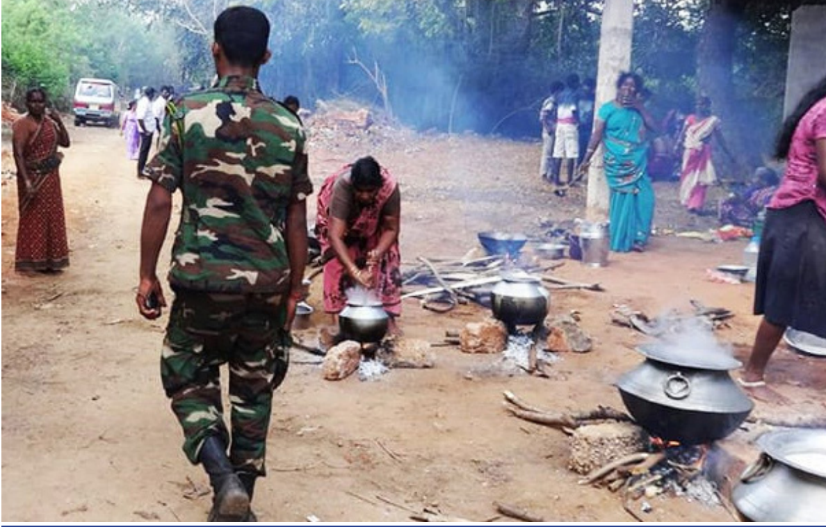
மக்களின் அன்றாட வாழ்வில் இராணுவத்தின் தலையீடு

ஆனால் இதனை ஒரு மனித உரிமை மீறல் என்பதை ஏற்றுக் கொள்வதற்கே 30 ஆண்டுகள் இந்த உலகிற்கு தேவைப்பட்டுள்ளன என்றால் இந்த உலகம் எவ்வளவு அபத்தமானது? பல இலட்சம் மக்களின் உயிர்களை காவு கொடுக்க வேண்டிய நிலைக்கு ஆளாக்கப்பட்டது என்பது எவ்வளவு கொடூரமான விசயம். ஒரு கொடும்போரின் இறுதி நாட்களில் மாத்திரம் ஒன்றரை லட்சம் மக்களை பலிகொடுக்க வேண்டி ஏற்பட்டதே?