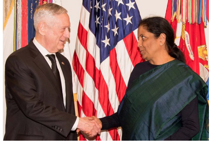
போரின்பின் வடக்கில் அங்கக் குறைபாடுகளுடைய குழந்தைகள் பிறப்பு அதிகரிப்பு

இந்தச் சந்திப்புகளின் போது, இந்தோ—பசுபிக் பிராந்தியத்தின் தற்போதைய நிலவரம் தொடர்பாக முக்கிய கவனம் செலுத்தி ஆராயப்பட்டது. குறிப்பாக, இலங்கையின் தற்போதைய அரசியல் நிலவரங்கள் குறித்து இந்தச் சந்திப்பின் போது, முக்கியமாக—விரிவாக கலந்துரையாடப்பட்டதாக அதிகாரிகள் தெரிவித்துள்ளனர். அத்துடன், ஆப்கானிஸ்தான், பாகிஸ்தான், மாலதீவு ஆகிய நாடுகள் தொடர்பாகவும் அமெரிக்க—இந்திய தரப்புகள் பேச்சுக்களை நடத்தியுள்ளன.