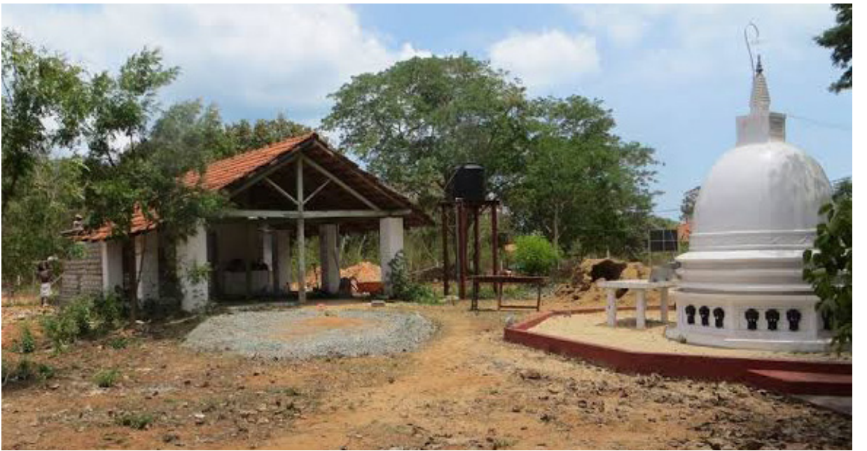
காங்கேசன்துறையில் சைவ ஆலயத்திற்கு முன்பாக கட்டப்பட்டுள்ள பௌத்த விகாரை

போயிருக்கிற இனப்பிரச்சினைக்கு இதுதான் அடிப்படைக் காரணமாக இருக்கிறது. எம்முடைய மண்ணில் நாம் வாழ முடியாது. நம்முடைய அடையாளங்களுடன் நாம் வாழ முடியாது. நாம் நாமாக வாழ முடியாது. நம்முடைய வரலாற்றைப் படிக்க முடியாது. நம்முடைய வரலாற்றை பேச முடியாது. இழந்த உரிமைகளைப் பற்றி பேசவும் அதனைக் கோரவும் முடியாது. உலகமயமாதல் சூழலில் உலகின் ஒவ்வொரு செயற்பாடுகளையும் அவதானிக்கின்ற, அல்லது தட்டிக் கேட்கக்கூடிய காலம் ஒன்றிலேயே நாம் பலவந்தமாக இன்னொரு வாழ்க்கையில் அமிழ்த்தப்படுகிறோம். அப்படியெனில் இலங்கை எத்தகைய மனித