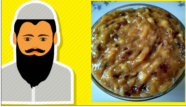
மேலும் தெரியவருவதாவது, ஏறாலூரைச் சேர்ந்த நபர் ஒருவர் தனது சொந்தப் பெயரை மறைத்து சிவா என்ற தமிழ் பெயரில் கிளிவெட்டி முத்துமாரியம்மன்

குறித்த நபர் ஆலயத்துக்கு வரும் பக்தர்களுக்கு வழங்கப்படும் பஞ்சாமிர்தத்தில் கருத்தடை மாத்திரைகளை கலந்து கொடுத்தாரா? என்று பக்தர்கள் எழுப்பிய சந்தேகத்தையடுத்து அது தொடர்பில் ஆலய நிர்வாகபையினரை அழைத்து நேற்று மூதூர் காவல் துறையினர் விசாரணைகளை மேற்கொண்டுள்ளதாக தெரியவருகிறது. இச்சம்பவம் தொடர்பில்