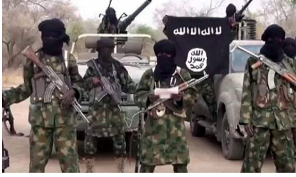
வந்து தாக்கினர். இந்த தாக்குதலில் 25 ராணுவ வீரர்கள் உள்பட பொதுமக்கள்

ஆபிரிக்க நாடான நைஜீரியாவில் சில ஆண்டுகளாக நைஜீரிய அரசினை எதிர்த்து போகோ ஹராம் தீவிரவாதிகள் வன்முறை செயல்களில் ஈடுபட்டு வருகின்றனர். இந்த அமைப்பின் தற்கொலை படையினர் நடத்திய தாக்குதல்களில் 20,000 பேர் உயிரிழந்துள்ளனர். 2 மில்லியன் மக்கள் இடம் பெயர்ந்துள்ளனர்.