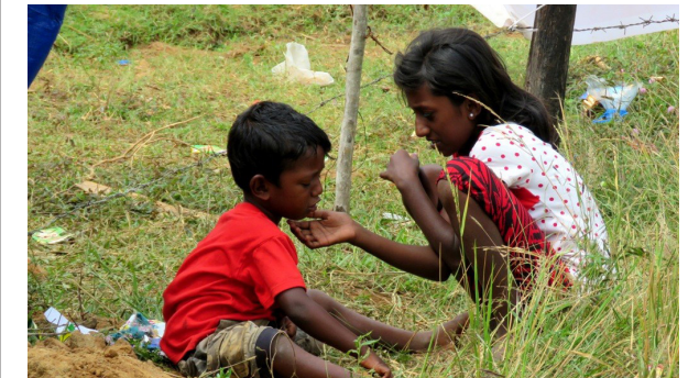
இலங்கை அரசு படைகளிடம் நிலத்தை பறிகொடுத்து வீதியில் நிற்கும் கேப்பாபுலவு சிறுவர்கள்

உச்ச பட்சமாக இராணுவம் காணிகளை விடுவித்துள்ளது கூட்டமைப்பு எம்.பி.க்களை அதீர்வைத்த சம்பந்தன் உரை