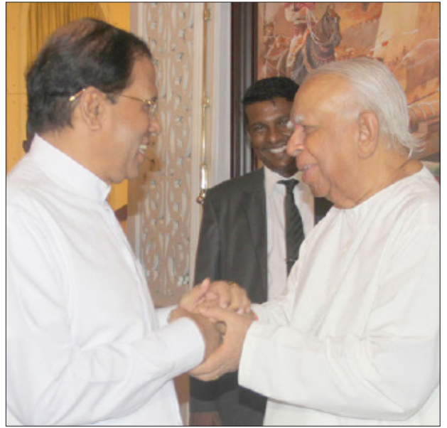
தொடர்ச்சியான கலந்துரையாடல்கள் மூலமும் தீர்வு காணும் நடவடிக்கைகளை எடுக்க வேண்டும்.

8. அரசியல் கைதிகள், காணாமல் போனவர்கள் மற்றும் மக்களின் காணிவிடுவிப்பு போன்றவற்றுக்கு சர்வதேச சமூகம் மற்றும் ஐக்கிய நாடுகள் சபை ஆகியவற்றின் உதவிகளுடனும் அரசாங்கத்துடனான