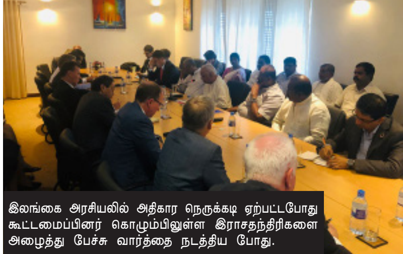
இலங்கை அரசியலில் அதிகார நெருக்கடி ஏற்பட்டபோது கூட்டமைப்பினர் கொழும்பிலுள்ள இராசநந்திரிகளை அழைத்து பேச்சு வார்த்தை நடத்திய போது.

இறுதி யுத்தம் முடிவடைந்த பின்னர் பல்வேறு இடங்களில் வைத்து எமது உறவினர்களை கையளித்தாலும் இந்த வட்டுவாகல் பாலத்தில்தான் எங்கள் உறவுகளை அதிகளவில் கையளித்துள்ளோம். சர்வதேச போர் விதிமுறைகளிலும் சர்வதேச சமூகத்திலும் முழு நம்பிக்கை வைத்தே இலங்கை அரசிடம் எமது உறவுகளை கையளித்தோம். இந்த சின்னஞ்சிறிய தீவில் கையிலே கொடுத்தவர்கள் எங்கே என்று பதில் தெரியாத அரசிற்கு ஐ.நா. மன்றம் கால அவகாசம் வழங்கியமை தவறு என்பதை கண்டித்தே வரலாற்று முக்கியத்துவம் வாய்ந்த இந்த பாலத்தடியில் போராட்டத்தை முன்னெடுத்து வருகின்றோம்.