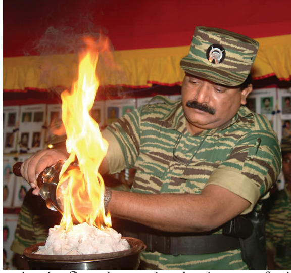
எங்கள் தேசப் புதல்வர்கள். மாவீரர் நாளென்பது நினைந்துருகிப் போகும் நிகழ்வு மட்டுமல்ல.

ஒவ்வொரு மாவீரர் நாள் ஏற்பாட்டுக் களங்களிலும் வெவ்வேறு வகையான நெருக்கடிகள், சவால்கள். எல்லா வகையான பின்புலங்களிலிருந்தும் எமது மக்களின் சுதந்திரமான அரசியல் வாழ்வுக்காக போராட்டத்தில் இணைந்து ஒன்றுபட்டு உழைத்து மானிட வாழ்வின் அதிபுச்ச ஈகங்களை புரிந்து மாவீரர்களானவர்கள்