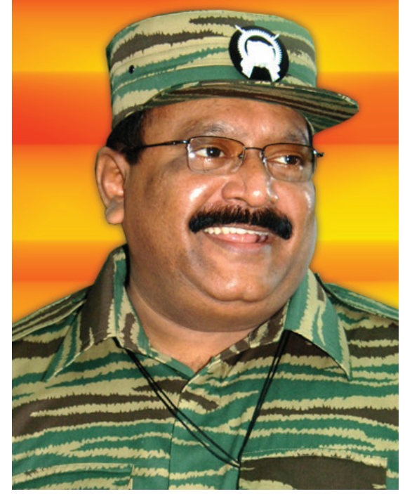
வேண்டும் என்ற உன்னத நோக்கத்தோடு வான்படை கட்டி, அந்த வானத்தையும் வசப்படுத்திக் காட்டினார் நம் தேசியத் தொடர்ச்சி கீழே...

வே.பிரபாகரன் அவர்கள். இனத்தின் விடுதலைக்காக.. தாய் நிலத்தின் அடிமை துயரைப் போக்க..மண்ணையும், கடலையும் ஆண்டால் போதாது.. விண்ணையும் வெல்ல