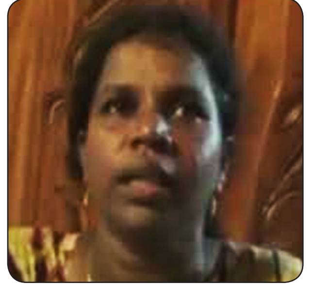
நானும் ஊருக்கு வந்தன்.

எங்களோடயே வந்துவிடு என்று மகளிட்ட கேட்டன். மகள் ஒரு நாள் என்னட்ட வந்தா. நான் ஊரில வைச்சிருந்தா பல கதைகள் வரும் என்கிறதால என்னோடயே விசா எடுத்து கூட்டுக்கொண்டு போய் விட்டேன். நான்கு மாதம் அங்க நல்லபடியா இருந்தா. தான் ஊருக்கு போய் படிக்கப்போறன் எண்டா. மகளை முதலில் அனுப்பினன். எனக்கு சுகமில்லாமல் வரவும் திரும்பவும்